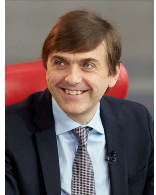
Министр просвещения РФ Сергей Кравцов

Следующее направление – современная инфраструктура, созданная в том числе в рамках национального проекта «Образование». Строятся и ремонтируются школы и детские сады, в также открыты 79 региональных центров, работающих по модели «Сириус», открыто более 250 центров «IT-куб», 365 технопарков-кванториумов, а также более 17 тысяч центров образования цифрового, естественнонаучного, технического, гуманитарного профиля «Точки роста».